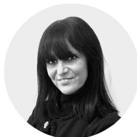
a cura di / Emma Marcandalli Managing Director